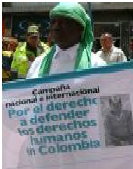
Bogotá D.C. 24 de mayo de 2010 - Comunicaciones Campaña Defensores

Amenazas, seguimientos, atentados, homicidios, robos de información y otras modalidades de agresión se vieron dramáticamente incrementadas en el último mes en Colombia en contra de los trabajadores de los derechos humanos. Esta situación llevó a un grupo significativo de reconocidos defensores de los derechos humanos en Colombia a exigirle al Ministro Valencia Cossio, medidas urgentes para salvaguardar la vida, la integridad y la seguridad de los defensores.